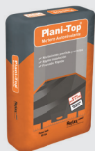
1 bolsa de Plani-top ®

La mezcla debe hacerse con una propela agitadora en conjunto con un taladro o mezclador que tenga bajas revoluciones y alto torque. El rango de velocidad sugerida es de 150 - 600 RPM. Siempre debe de agregarse el polvo al agua, no al contrario.